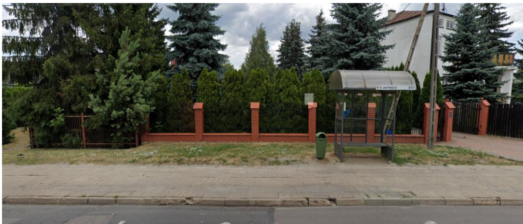
Rysunek 2 Przystanek "Al. Jana Pawła II 2" w kierunku południowym